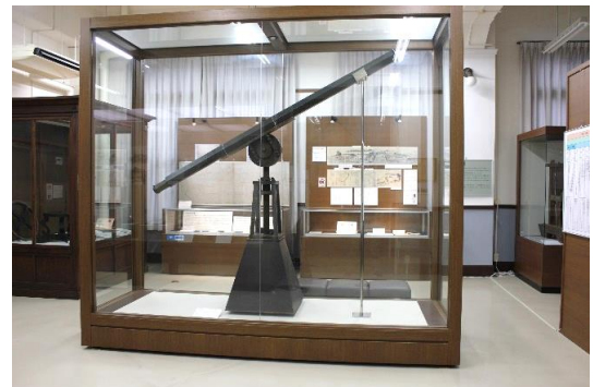
第2展示室・久米通賢資料室

主な収蔵資料は古文書・古書籍・絵図・写真・漆器・陶磁器・化石などの他、坂出塩田を築いた久米通賢関係資料(国指定重要文化財)、考古資料などが約6万点ある。